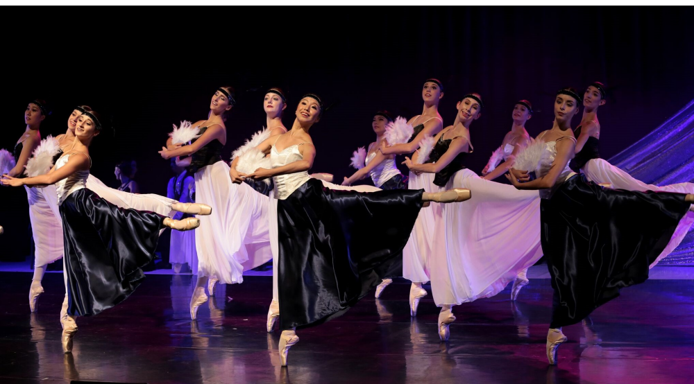
LES FIANCEES « LE LAC DES CYGNES »