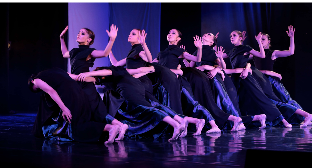
SHEHERAZADE « NIJINSKI ET LES BALLETS RUSSES »