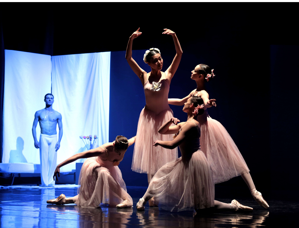
PAS DE QUATRE DE PUGNI « NIJINSKI ET LES BALLETS RUSSES »