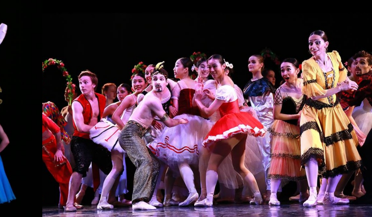
« HOMMAGE A MARIUS PETIPA » GRAND AUDITORIUM DE CAEN – FEVRIER 2018