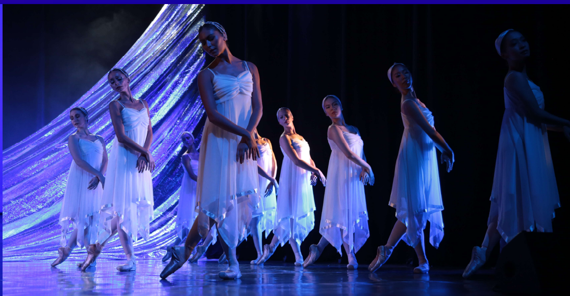
« LE LAC DES CYGNES » GRAND AUDITORIUM DE CAEN – OCTOBRE 2016