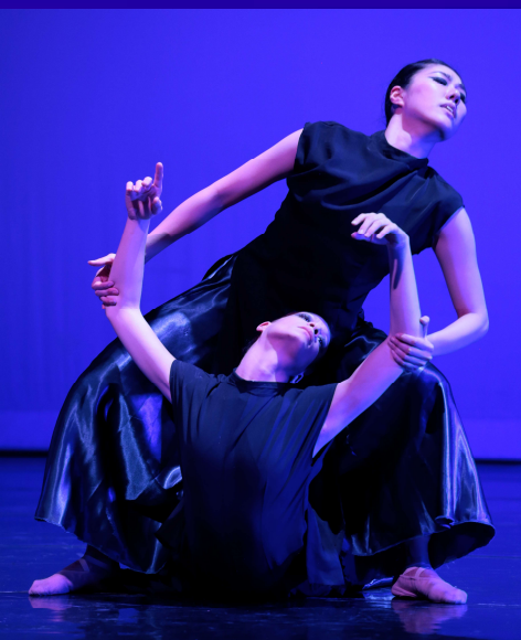
« SHEHERAZADE » GRAND AUDITORIUM DE CAEN – JANVIER 2017