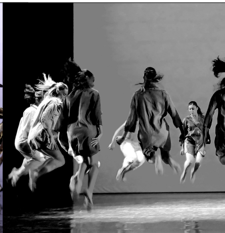
« BOLERO » / « LE SACRE DU PRINTEMPS » GRAND AUDITORIUM DE CAEN – OCTOBRE 2017