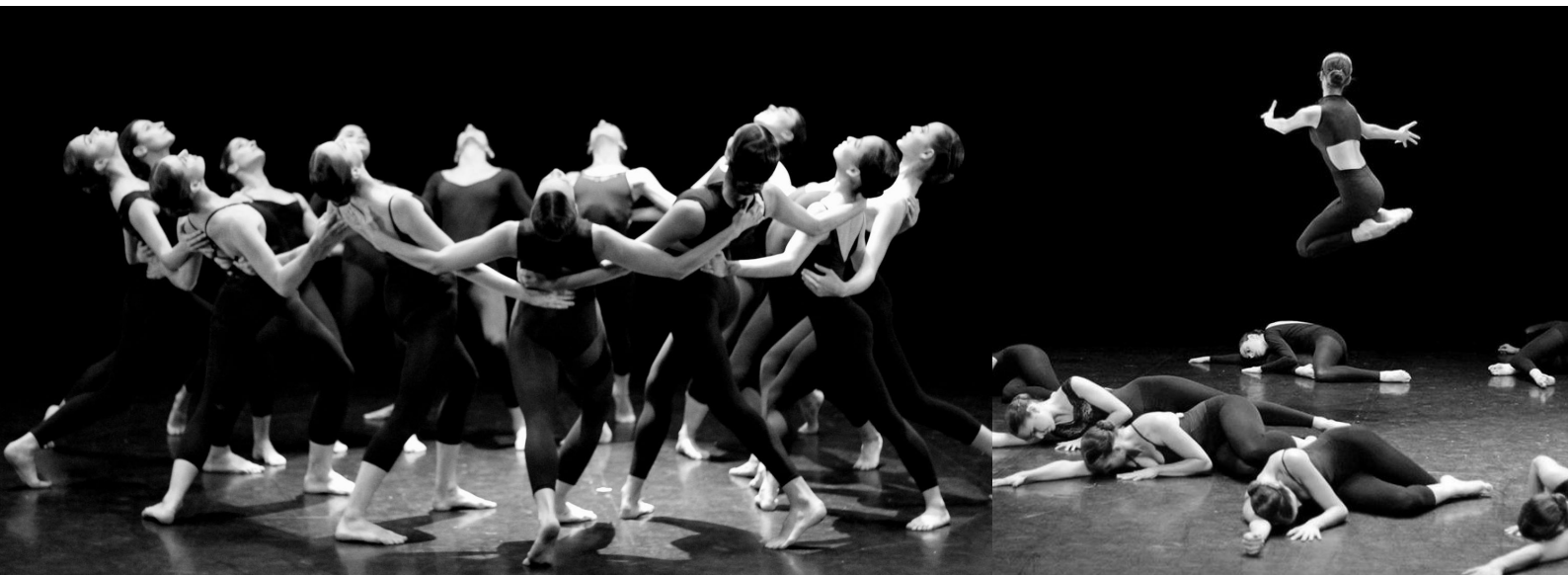
« SOIREE HOMMAGE » THEATRE ALTIGONE – DECEMBRE 2016