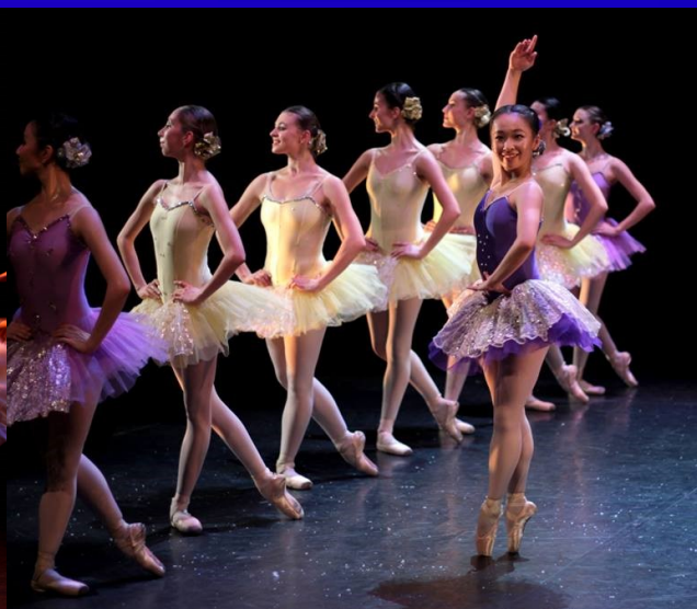
« PAQUITA » THEATRE ALTIGONE – DECEMBRE 2016