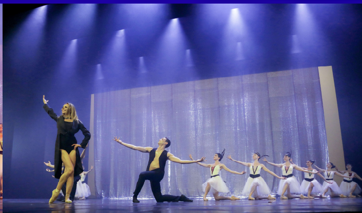
« DANCING ALONG, WITH EVERY SONGS » THEATRE DE CAEN – MAI 2017