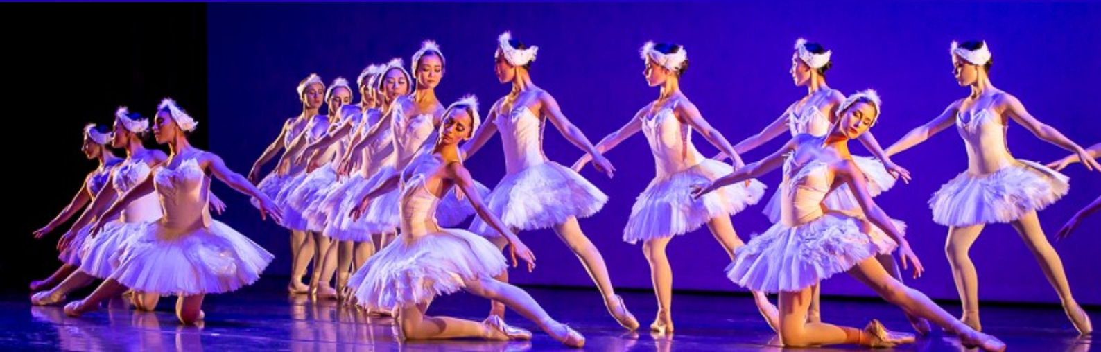
« LE LAC DES CYGNES » THEATRE DE CENON – FEVRIER 2019