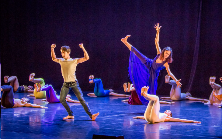
«BIM, CLOWN DE DIEU » THEATRE DU ROCHER PALMER, CENON – JANVIER 2018