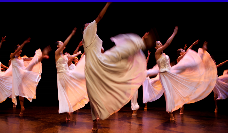
« LUMINAISANCE » THEATRE ALTIGONE – SEPTEMBRE 2016