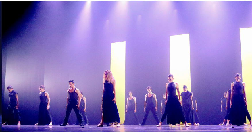
« LE MARQUIS DE CUEVAS » THEATRE DE CAEN – MAI 2017